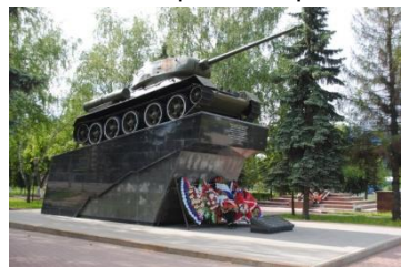
Недалеко от военного мемориала стоит

Итак, завершая экскурсию по улице Чехова, мы пришли на Главную городскую площадь. Именно здесь располагается мемориал героям Великой Отечественной Войны, сквер А.П.Чехова, а также Администрации городского округа Чехов.